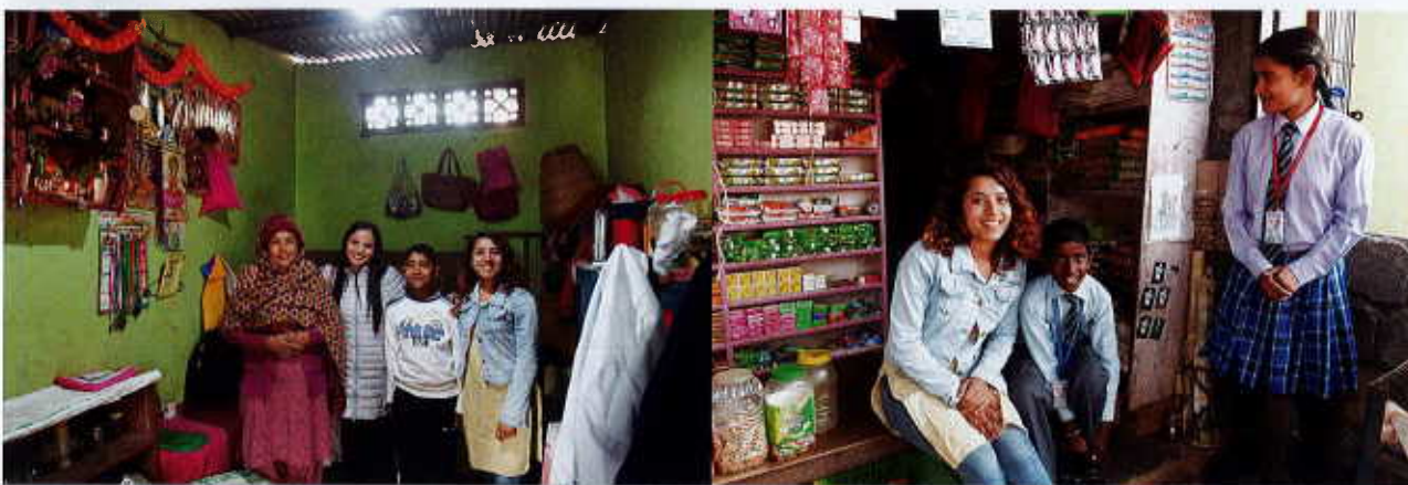
Chez des Edu-care families

Augmenter le budget de fonctionnement de Sos-Bahini permettant de multiplier la prise en charge de telles familles est devenu une priorité.