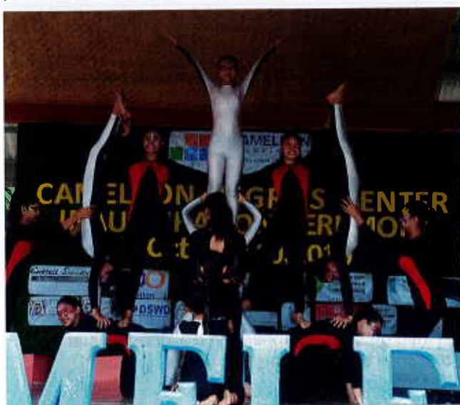
Inauguration de Centre Caméléon à Silay

Le nouveau centre de Silay a été inauguré le 10 octobre 2019 en présence des autorités locales, des membres du conseil d'administration de Caméléon Philippines et des donateurs. Le centre d'accueil de Silay pourra ainsi accueillir jusqu'à 40 bénéficiaires directes.