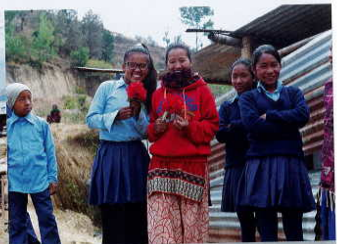
Groupe d'écoliers à Samundradevi

Même si ce projet a joué avec nos nerfs, nous sommes fiers de l'avoir réalisé, alors qu'aucune autre organisation ni autorité népalaise n'est intervenue dans les prédits villages après les séismes de 2015. Notre coopération à Luxembourg avec l'ONGD FNEL et PSF a fonctionné harmonieusement et nous en sommes heureux.