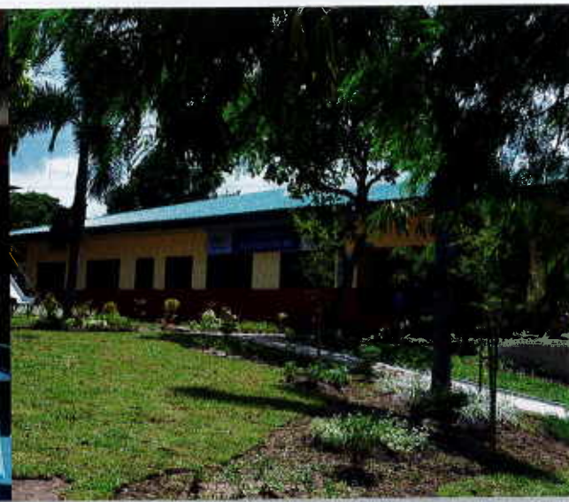
Le nouveau Centre Caméléon de Silay