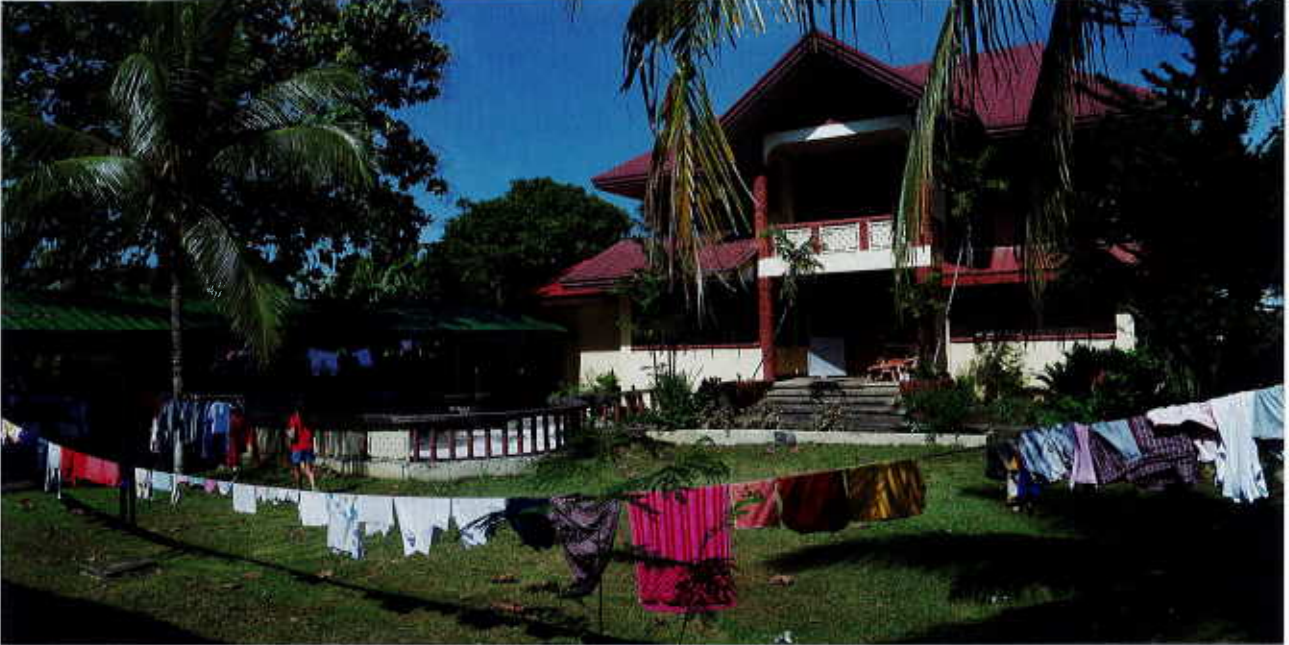
Centre Caméléon à Passi

L'achèvement de la construction du troisième centre d'hébergement Caméléon/CHL à Negros :