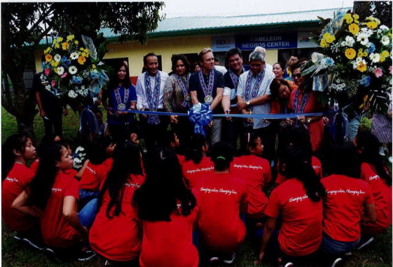
Inauguration de Centre Caméléon à Silay

La maison d'accueil de Silay, sur l'île de Negros, est quant à elle située en plein centre de cette île. Depuis mai 2019, 20 jeunes filles, âgées de 5 à 17 ans, victimes de violences sexuelles, sont hébergées dans ce nouveau centre dans un milieu sécurisé situé à proximité de leur communauté. Tout comme leurs « sœurs » du centre de Passi, elles sont intégrées dans un programme post-réintégration et elles sont suivies dans leur réinsertion familiale et professionnelle.