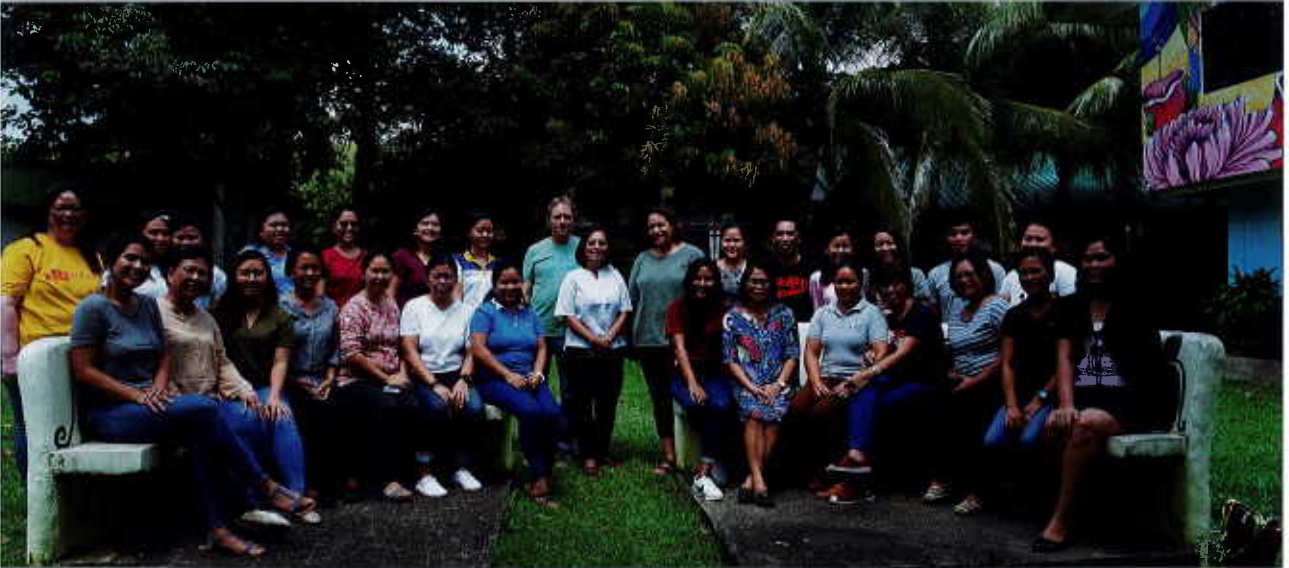
Staff Caméléon à Passi

Ce projet a démarré en 2016 et a été quelque peu ralenti à cause du choix et de l'attribution du terrain qui a finalement été généreusement offert par la mairie de Silay.