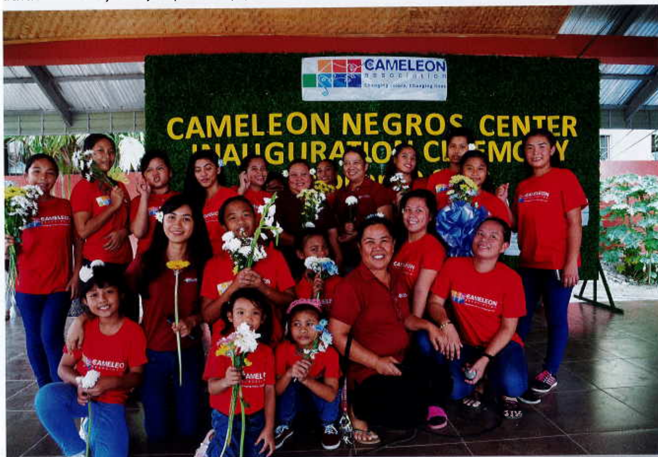
Les nouveaux bénéficiaires du Centre Caméléon à Silay

Après 4 années sans visite sur place, j'ai pu enfin me rendre à nouveau aux Philippines pendant deux semaines. Ce voyage, riche en émotions, m'a permis de me rendre compte, une fois de plus, de l'excellent travail réalisé au jour le jour par les équipes de Caméléon.