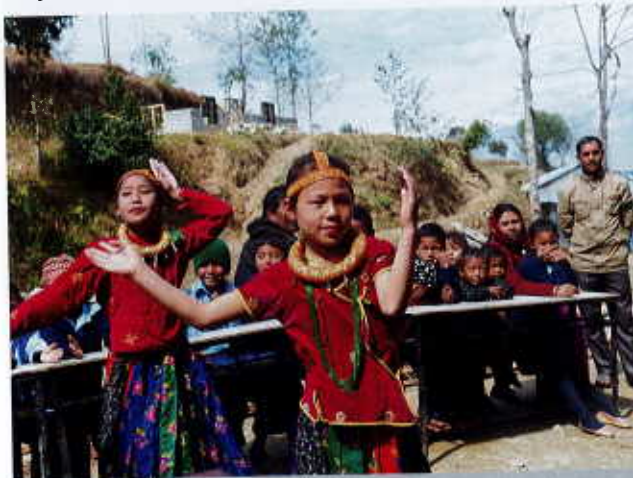
Accueil à Kakani

Lors de mon voyage sur site en février 2019, j'ai réalisé que nous étions encore bien loin de la fin des travaux et que les promesses répétées ne correspondaient pas à la réalité. Nous avons, par contre, constaté en même temps que les travaux étaient réalisés suivant les normes exigées de « Build back better » et que les nouveaux bâtiments devraient a priori résister mieux à d'éventuels futurs séismes. Suite à des réunions de chantier un peu musclées qui ont permis un accord sur une extension budgétaire de quelque 40.000.- euros, la situation a été débloquée et les travaux d'achèvement ont été lancés. TdH nous assure que les constructions sont depuis quelques semaines prêtes à être réceptionnées. Les inaugurations officielles des écoles de Samundradevi, de Thanapati et de Kakani sont prévues au courant de la prochaine visite de Pit Kayser, Nadine et moi-même début février 2020.