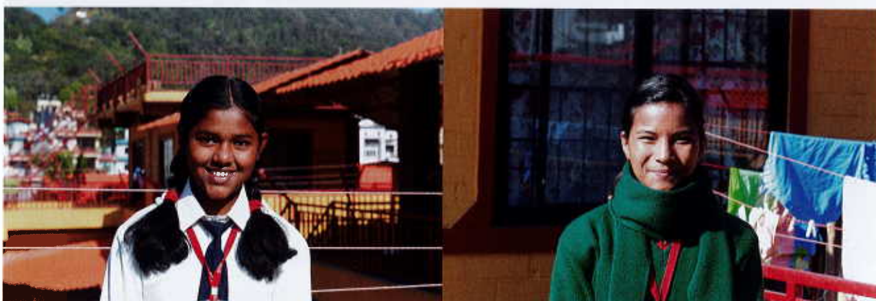
Portraits de jeunes Bahini

Comme chaque année, SOS BAHINI a accueilli quelque 15 nouvelles jeunes bénéficiaires entre 5 et 10 ans et a veillé à la meilleure réintégration possible d'une douzaine de jeunes filles formées qui, après un passage de trois à quatre ans au Cross Roads House, ont quitté notre organisation.