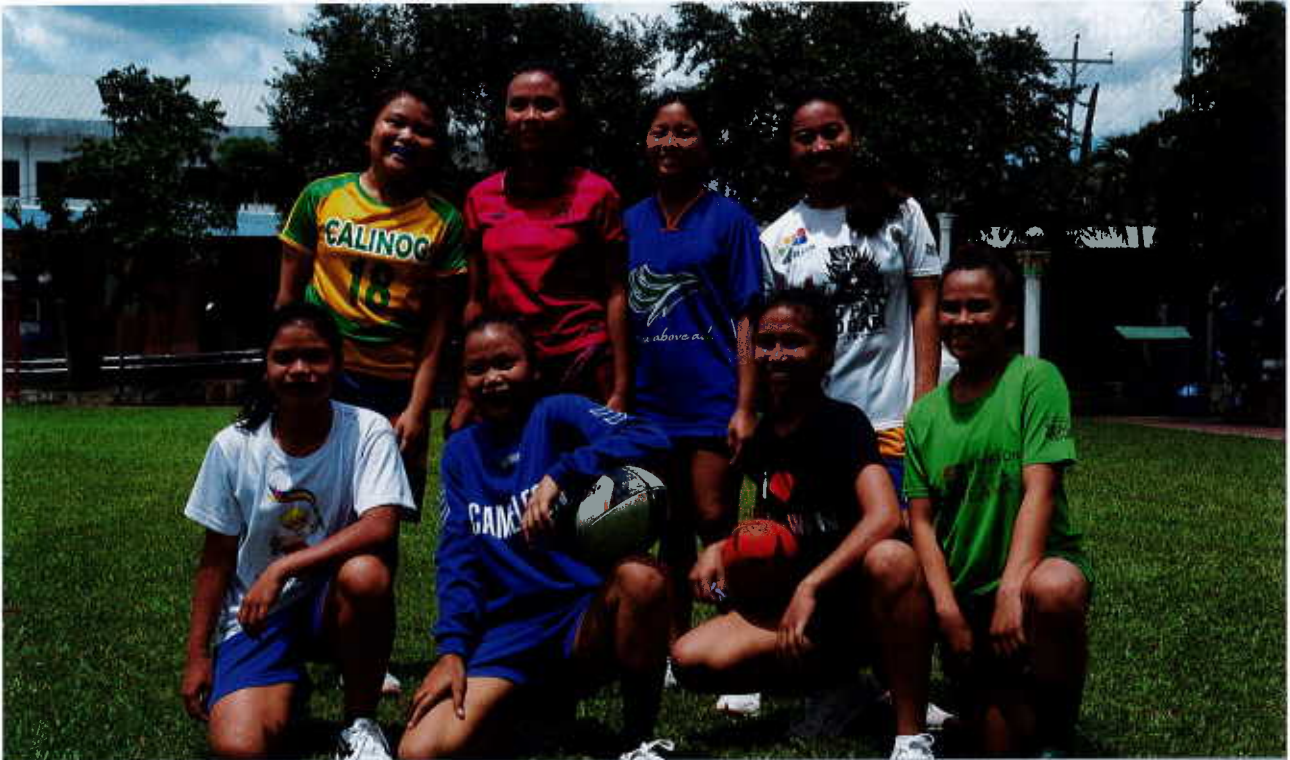
Equipe de Rugby de Caméléon

La maison d'accueil de Silay, sur l'île de Negros, est quant à elle située en plein centre de cette île. Depuis mai 2019, 20 jeunes filles, âgées de 5 à 17 ans, victimes de violences sexuelles, sont hébergées dans ce nouveau centre dans un milieu sécurisé situé à proximité de leur communauté. Tout comme leurs « sœurs » du centre de Passi, elles sont intégrées dans un programme post-réintégration et elles sont suivies dans leur réinsertion familiale et professionnelle.