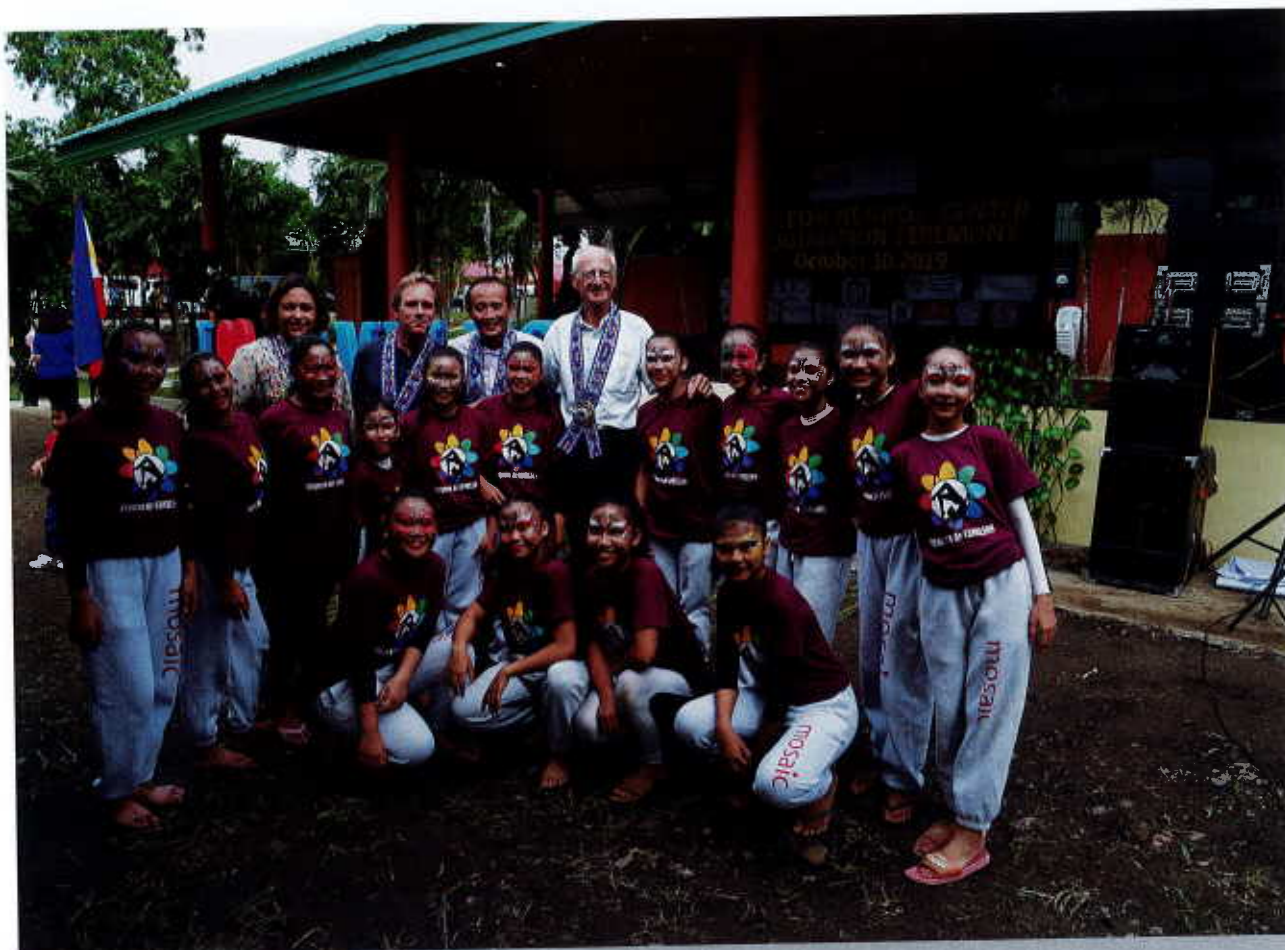
Inauguration de Centre Caméléon à Silay

Le projet est cofinancé par le Ministère des Affaires Etrangères (66 %) et par l'apport privé (34 %) couvert presque intégralement grâce à la générosité de la Fondation NIF.