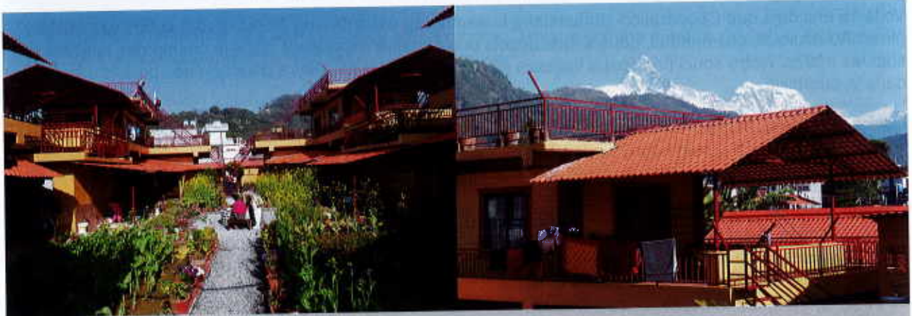
Nouvelle extension de l'Eco-village à Pokhara