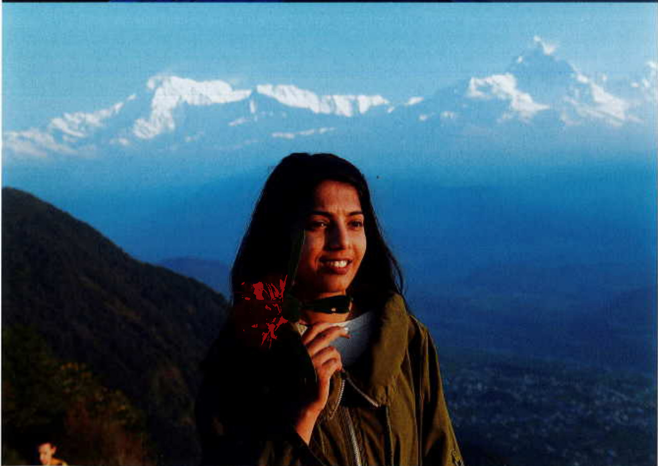
Excursion matinale avec vue sur l'Annapurna