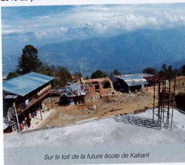
Sur le toit de la future école de Kakani

Dans notre rapport de l'année dernière, nous vous informions que la fin des travaux était prévue pour mars 2019 au plus tard. En réalité il n'en était rien.