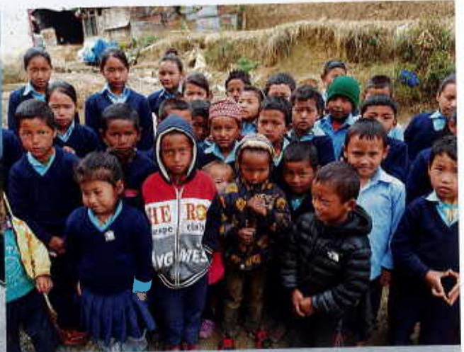
Accueil à Kakani

Malgré de multiples relances par nos partenaires PSF, FNEL et nous-mêmes à l'adresse des réalisateurs des projets TdH Germany, les chantiers n'ont pas avancé comme promis. Des délais dus aux intempéries et une augmentation du coût des matériaux de construction ont encore retardé l'achèvement des travaux.