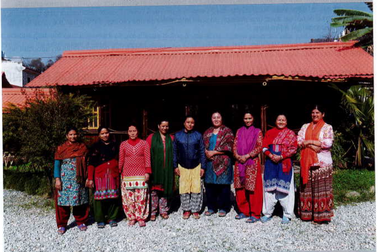
Bahini house mothers